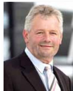
Alois Gerig CDU