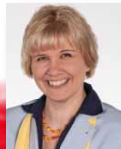
Ulrike Quoos FDP