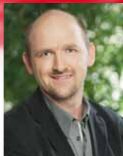
Hans-Detlef Ott Bündnis 90/Die Grünen